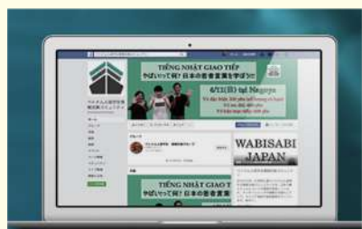
日本での生活情報の提供

会員には日本で初めてとなる「所得補償保険」が付与されます。 技能実習生がケガをした時に、一定額の所得が補償されます。