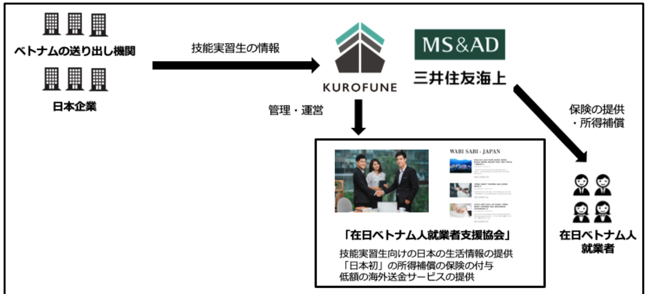
↑ 在日ベトナム人向け所得補償保険のスキーム

管理組合や業界・業種によらずご加入頂け、会費も一律で設定しています。会員の年会費は1万5千円で所得補償保険の月額補償額は最大10万円、総補償額は最大120万円となっています。在ベト協会へのご加入を希望される際は、HPを通じてお問い合わせを頂くようお願い申し上げます。