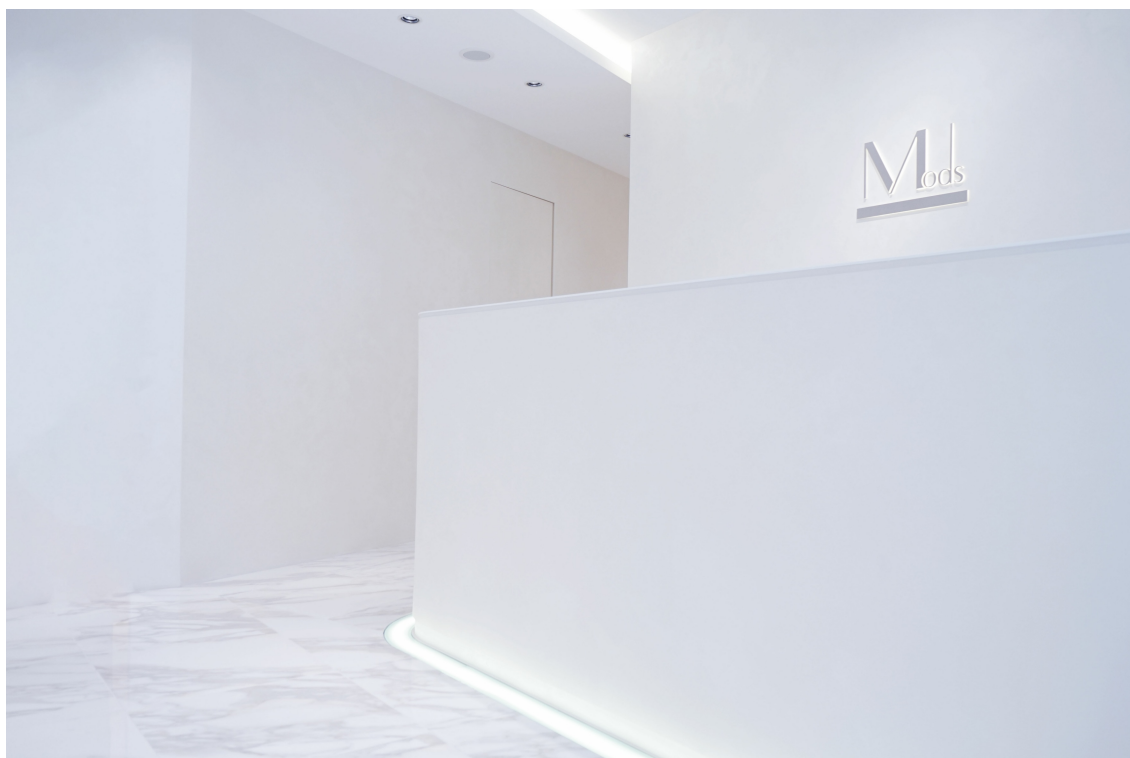
モッズクリニック院内エントランス