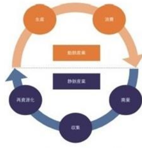
図 1-3 動脈産業と静脈産業

事業者向け環境/廃棄物マネジメントのパイオニアである株式会社サティスファクトリー（本社：東京都中央区、代表取締役社長：恩田英久）は、静脈産業※1,000 社からアンケートを得た独自調査、全国各地に立地する 9,500 カ所の中間処理場および最終処分場への多面的な調査・分析を基に、廃棄物業界の最新動向データ『再資源化白書 2021』を 2021 年 6 月 30 日（水）に発売いたします。