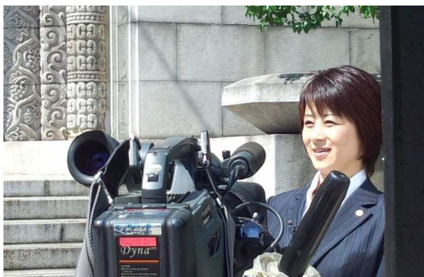
<荻田 ゆかり 議員のインタビューシーン>