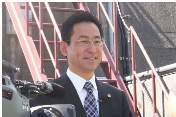
<肥後 洋一朗 議員のインタビューシーン>