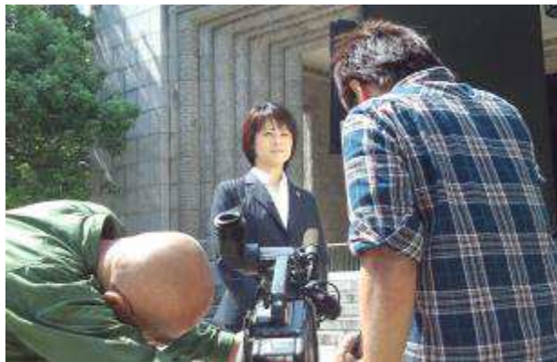
<萩田 ゆかり 議員のインタビューシーン>