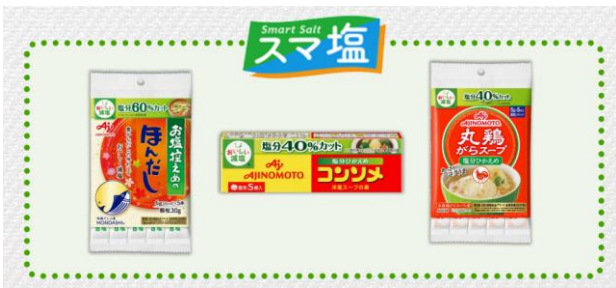
左から、「お塩控えめ・ほんだし®」6gスティック5本入袋、「味の素KKコンソメ」<塩分ひかえめ>5個入箱、「丸鶏がらスープ」<塩分ひかえめ>5gスティック5本入袋

当社はこれからも減塩製品と“Smart Salt(スマ塩)”プロジェクトの取り組みを通じて、簡単・手軽な「おいしい減塩」の実践をサポートし続けます。