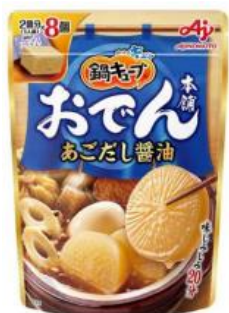
「鍋キューブ® おでん本舗」 <あごだし醤油>