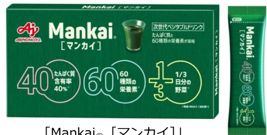
「Mankai ® [マンカイ]」 30本入り(約30日分)

※3) スティック1本当たり、厚生労働省が推進する「健康21」において1日分の野菜目標摂取量350gの1/3にあたる、約117g分の葉野菜マンカイ(ウォルフィア)を乾燥させた原料を使用しています。