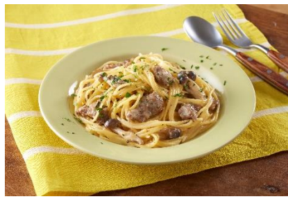
<チーズ>を使ったサルシッチャのパスタ