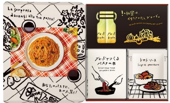
<トマト>パッケージ内側(6食入)

7種類の野菜とハーブを使った豊かな味わいをパウダーにギュッと凝縮しているため、香味野菜が香るソースが麺に絡んだ極上パスタを簡単に作ることができます。また、ソースをベースの味付けにとどめているので、旬の具材を使うなど好みに合わせたアレンジを楽しめます。