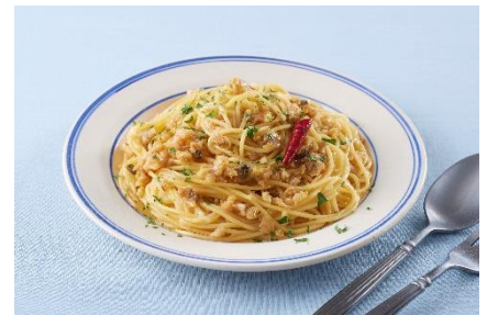
<魚介>を使った魚介のラグーパスタ

当社は、「Mio Brodo™」の販売を通じて、食卓に新鮮な驚きや喜びを届けることで、人・社会・地球のWell-beingに貢献することを目指します。