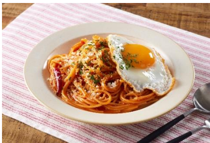
<トマト>を使ったポペレツロ ロッソ