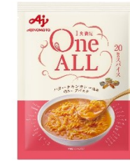
＜バターチキンカレー風味のスープパスタ＞

2022年の完全栄養食(1食で必要な栄養素がバランスよく摂れる食品)の国内市場規模は、食事に対する健康意識と簡便性の高い食品需要の高まりから、約144億円まで拡大しています(下図参照)。