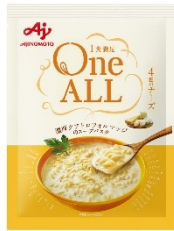
＜濃厚クアトロフォルマッジのスープパスタ＞

※1)女性のための完全栄養食：食事摂取基準で定められた33種のうち熱量・炭水化物・脂質以外の栄養素を18歳以上女性の1日の基準値の1/3以上含有する食品(当社定義)