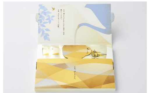
<かつお> パッケージ内側

お客様向けお問い合わせ先：AJI MALL お客様係 https://mall.ajinomoto.co.jp/