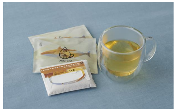
<かつお> 個装と ドリップして抽出した“飲むおだし”