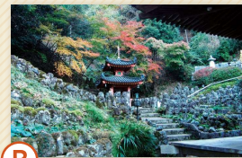
愛宕念仏寺 元は東山に建てられた古刹で、比叡山の末寺。1,200株の石造の糖漬さんが表情豊かに並び、訪れる人の心を和ませてくれています。