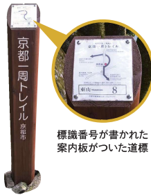
標識番号が書かれた案内板が貼られた道標

京都一周トレイル®のなかでも人気の東山コース・西山コースの一部がスタンプラリーの対象です。ヤマスタで該当コースに参加し出かけた後、ルート上にある所定の標識番号の道標周辺でチェックインしよう。チェックイン場所周辺の名所をデザインしたスタンプが出せます。