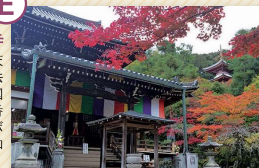
今熊野観音寺 平安時代、嵯峨天皇の勅願により弘法大師が開創。西国三十三所第十五番札所、頭痛封じ、ボケ封じの寺として知られます。