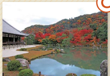
天龍寺 足利尊氏が後醍醐天皇を奉うために創建した寺院。嵐山を借景にした池泉回遊式の庭園は夢窓国師の作庭です。