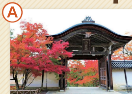
二尊院 総門は伏見城の遺構と伝えられる東医門。本尊に釈迦と阿弥陀の二如来を祀っています。