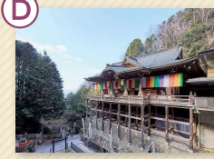
狸谷山不動院 「タヌキダニのお不動さん」の名で知られ、懸崖造りの本堂には安齋300年を超える石像不動明王が鎮座しています。