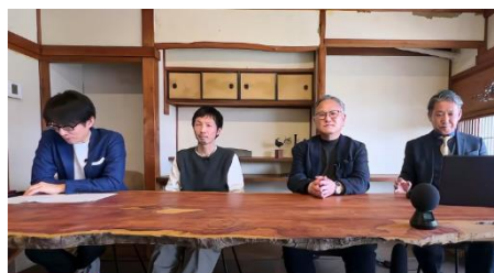
トークセッションの様子

京都のまちなかで新たに京町家を活用し、学生と企業、子ども、クリエイターが集う居場所を提供されている方々をお迎えし、多様な活動の状況や、なぜ京町家を選ばれたのかをお聞きし、さまざまな社会ニーズとそれに応える京町家の可能性、実現性について掘り下げていただきました。