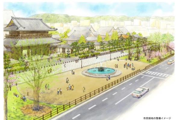
市民緑地の整備イメージ

京都市建設局 みどり政策推進室 電話 : 075-222-4114 (平日 8時45分~17時30分)