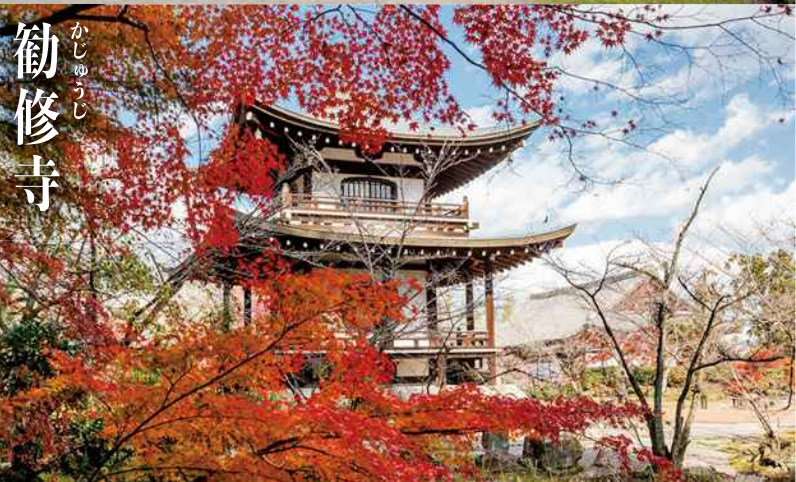
かじゅうさい 勧修寺