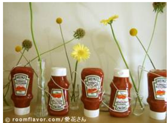
逆さケチャップをホームパーティーのディスプレイに使った例

お部屋に逆さケチャップを飾り、その画像を自分のブログで公開してURLを送って下さった方の中から、抽選でハインツオリジナルグッズをプレゼントします。また逆さケチャップのブログパーツを無料配布し、それを自分のブログに公開してURLを送って頂いた方にも抽選でハインツオリジナルグッズが当たります。