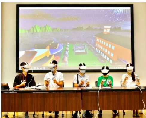
立命館守山高校での実施体験の様子

異なる場所にいるパネリストが空間を越えて、一つのメタバース内で議論を交わし、若者が残したい滋賀県の映像や3Dモデルで投影、リアルタイムでSNSのコメントをメタバース上に表示するなど、最新の技術を駆使したセッションになる予定です。新しい技術を使った、新しい世代による、新しい試みを、ぜひご覧ください。