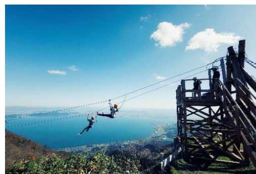
ジップラインアドベンチャー