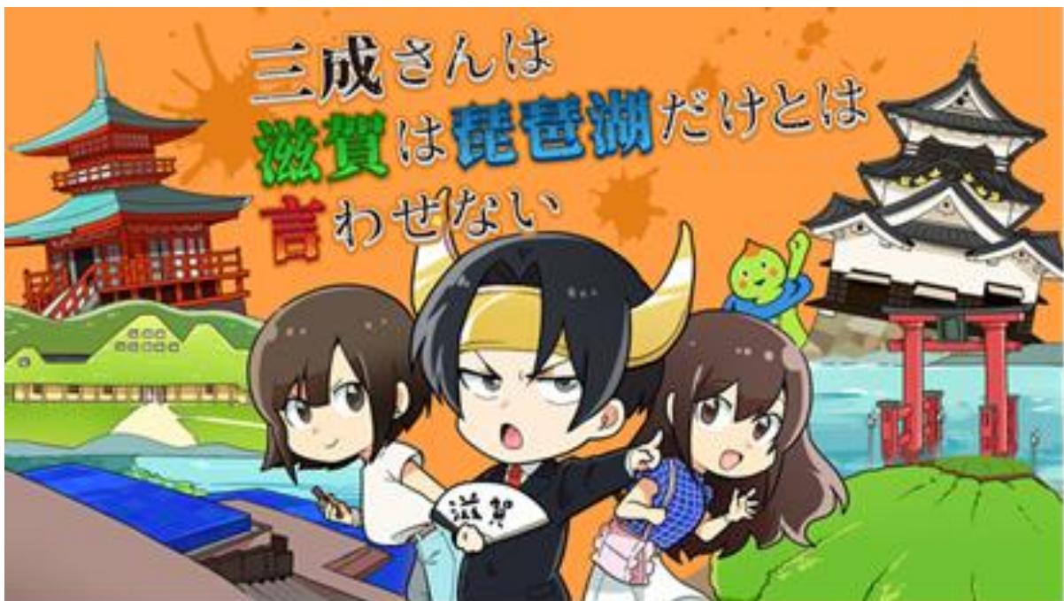
「三成さんは滋賀は琵琶湖だけとは言わせない」タイトル画面

漫画『三成さんは京都を許さない－琵琶湖ノ水ヲ止メヨ－』 作者のさかなこうじさんとコラボした滋賀県のPR動画を制作！ 三成さんは滋賀は琵琶湖だけとは言わせない 滋賀県公式 YouTube で 2020年7月7日（火）から公開開始！