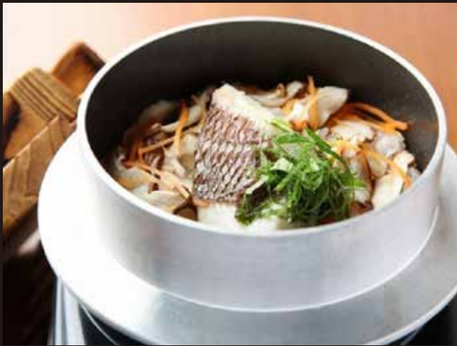
羽釜で炊いた鯛めし 1200円