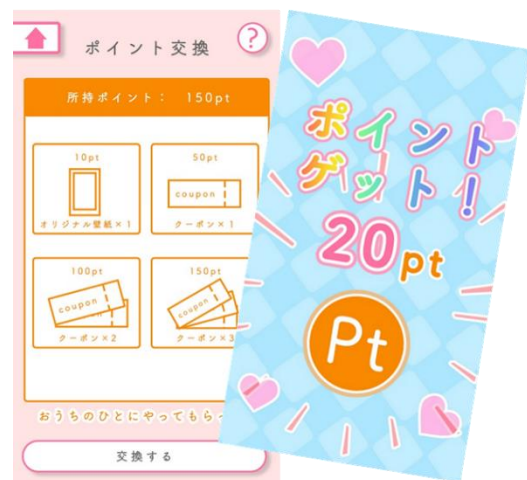
各種ごほうび (画像はイメージです)