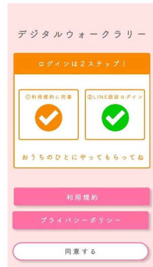
LINE ログイン (画像はイメージです)