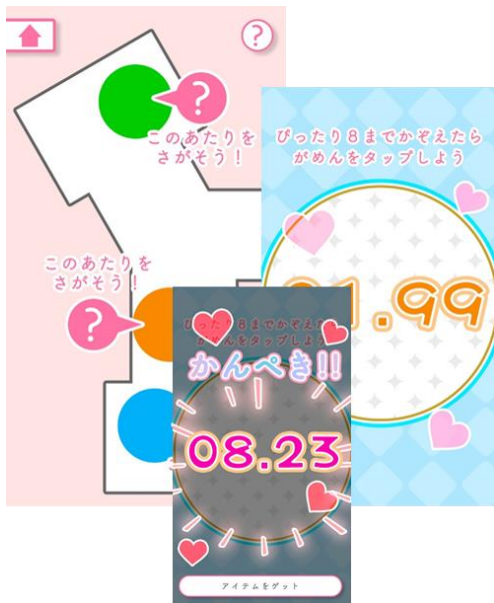
マップ・ミニゲーム (画像はイメージです)