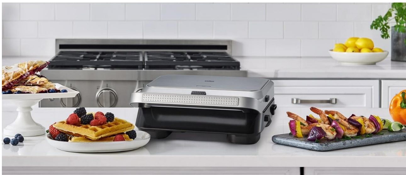
ブラウン スナックメーカー 5 (SM5038)

ホットサンドやワッフルはもちろん、グリル調理も。 お気に入りの料理を、いつでも手軽に。