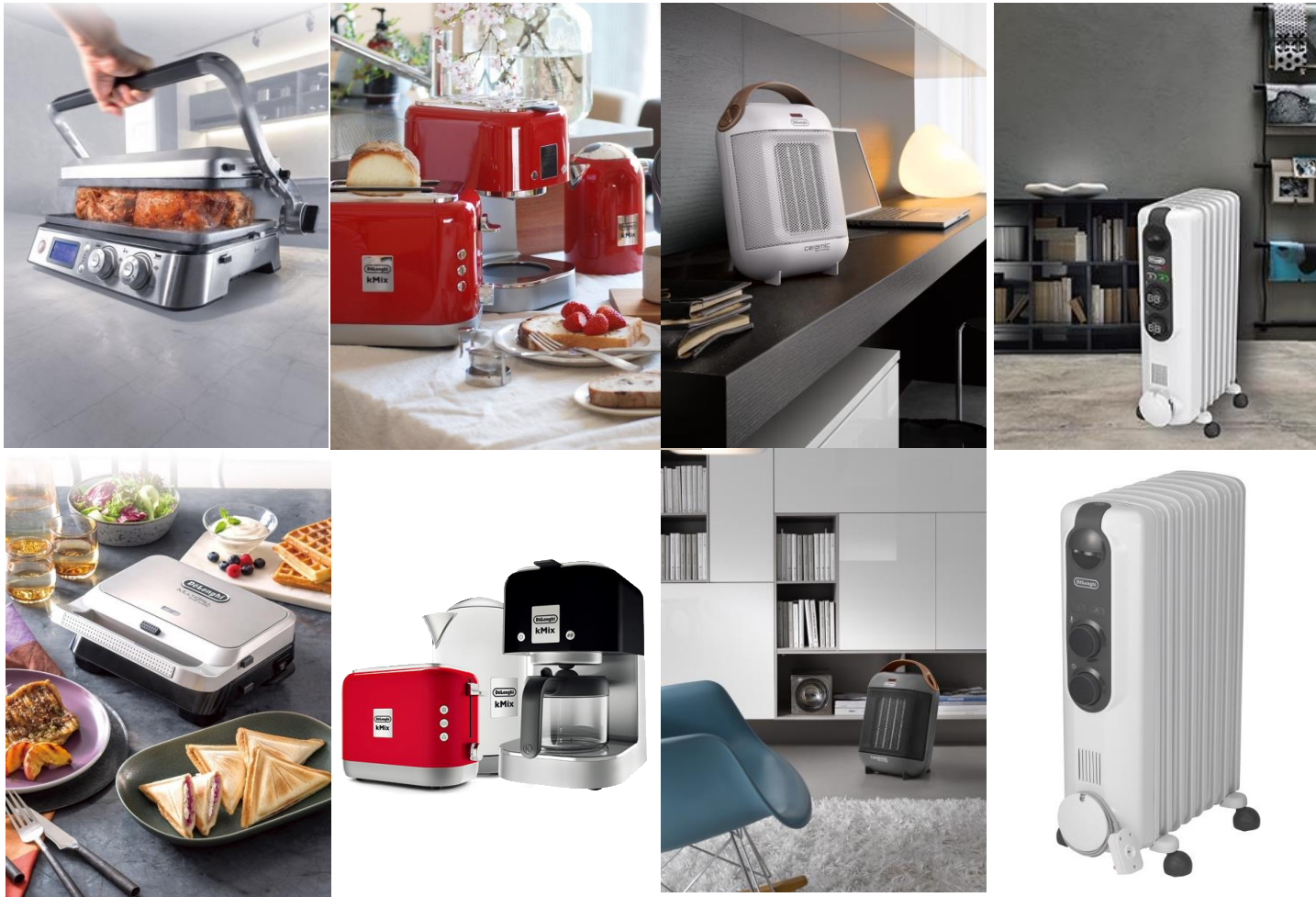
写真左から、マルチグリル BBQ & コンタクトグリルプレート (上)・マルチグリル エブリデイ サンド & ワッフルメーカー (下)、kMix (ケーミックス) コレクション、カブスーラ セラミックファンヒーター、アマカルド オイルヒーター