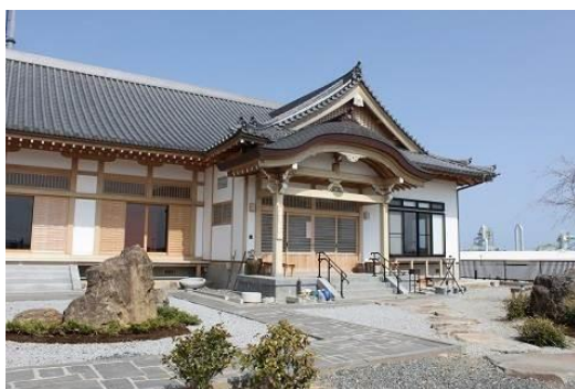
< 地福寺 >

JTB では、東北復幸支縁のための出開帳に賛同し、文化イベントの販売協力をすると同時に、収益の一部を寄付いたします。