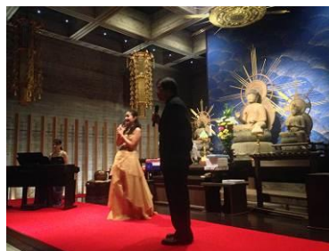
<楽しきかなコンサートイメージ>