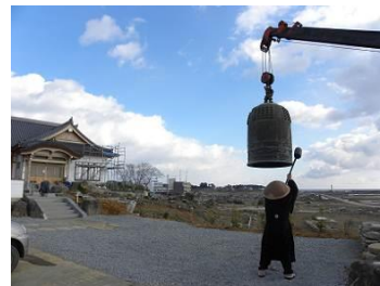
< 震災時の様子 >