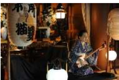
怪談の夕べ(イメージ)

申込 URL http://opt.jtb.co.jp/kokunai_opt/p/p1009131/