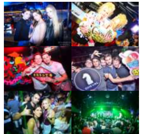
「ナイトライフ」を求める若者のニーズは世界共通 (イメージ)