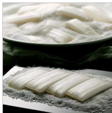
【宮城】晒（さらし）よし飴

限られた季節に、厳選した良質の水飴と砂糖を使い父子相伝の業でひとつひとつ手作り。霜柱のような飴の内側には空気を含んだ空洞があり、舌に乗せた途端にさらりと溶ける独特の食感を生み出します。