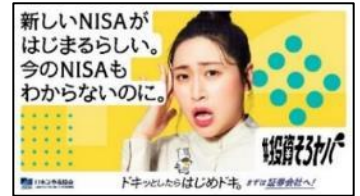
広告バナーイメージ