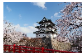
↑弘前さくらまつり

青森空港では今年の3月から3路線で定期便が増便され、アクセスが向上した青森県。今秋から100年ぶりに本丸石垣が修理される弘前城は、今年の春開催の「弘前さくらまつり」後に閉館し、現在の位置から天守を臨めるのは約10年後の予定となり話題となっています。またレジャーエリアでは早期予約の取り込みが好調で、「星野リゾート 奥入瀬渓流ホテル」や「星野リゾート 青森屋」では4月に露天風呂付客室をリニューアルオープンするなど、各宿泊施設の施策が功を奏しています。