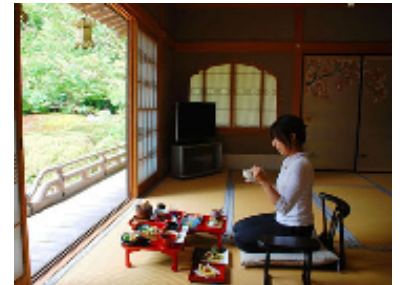
↑ 宿坊「高野山別格本山 総持院」では精進料理が楽しめる

2015年は高野山が開かれて1200年の節目の年。これを記念し、4月2日～5月21日の間実施される「高野山開創1200年記念大法会」では、毎日法会が営まれ、日本全国から弘法大師を慕う人々が高野山を訪れます。周辺の橋本・高野山エリアには多数の「宿坊」があり、高野山参拝に最適な立地条件であることに加えて、精進料理やお写経・早朝勤行などの体験も、宿坊に泊まる楽しみの一つとなっているようです。また、南紀白浜・龍神エリアは人気テーマパーク「アドベンチャーワールド」周辺のホテル予約が伸びています。「白浜温泉 コガノイベイホテル」では1年中楽しめるリゾートイルミネーションを実施、さらに同ホテルと「梅樽温泉ホテルシーモア」では近隣テーマパークにちなんで、かわいいパンダをお部屋でたっぷり堪能できる「パンダルーム」が人気を集めています。