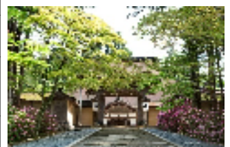
高野山金剛峯寺 (和歌山県)