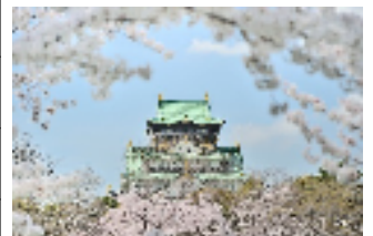
大阪城と満開の桜 (大阪府)