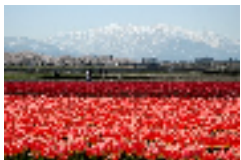
↑朝日町舟川べり桜並木

新駅の黒部宇奈月温泉駅周辺エリアの予約が好調な富山県は、北陸新幹線開業を機に予約が好調に推移しています。チューリップ球根出荷量日本一の富山では舟川べり