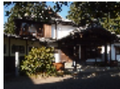
↑ドラマゆかりの地、前橋臨江閣本館→

昨年世界文化遺産として認定された「富岡製糸場」で話題となった群馬県は、引き続き同施設周辺エリアの予約が好調に推移しています。また、今年放映の大河ドラマ「花燃ゆ」ゆかりの地としても注目されています。今年4月にリニューアルオープンする「熱の湯」が話題の草津温泉では同+44.3%と伸張しています。