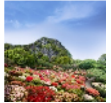
↑御船山楽園のつつじ谷

佐賀県では、昨年佐賀空港でLCC就航など、路線数や便数が増えて利用者数が過去最高を更新し、同県内の嬉野温泉・武雄温泉エリアの予約が特に好調です。同エリアでは御船山楽園にて「2015年花まつり」が開催され、例年の桜に続き、今年からつつじと大藤のライトアップもスタートすることで話題です。また今年から「嬉野酒蔵まつり」が「鹿島酒蔵ツーリズム」と同時開催となり新たな観光需要を促進しています。