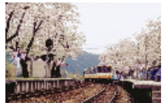
能登鹿島駅 (通称「能登さくら駅」) (石川県)