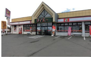
函館市 西浜 4 丁目 4 番 1 号