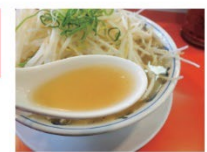
スープは香ばしく濃厚な味わい