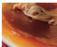
濃厚なトマトソースと肉をたっぷり絡める