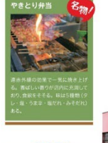
函館市の人気グルメ「花咲線弁当」