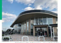
環子駅前 徒歩5分 (045) 前橋駅前