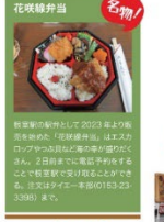
根室市の人気グルメ「花咲線弁当」