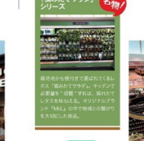
「福みたくサラダ」シリーズ