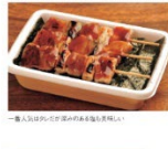
函館市の人気グルメ「花咲線弁当」

函館一筋、進化を続ける名物弁当 ハセガワストアは北海道函館市に展開するコンビニエンスストア。創業は1978年。現在は約10店舗を展開している。中道店は、近年人気を集めている「花咲線弁当」を主力商品として展開している。