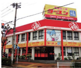
土古駅前 徒歩5分 (0594) 豊橋駅前

名古屋の愛称は「ラーメン」 名古屋の愛称は「ラーメン」。名古屋の愛称は「ラーメン」。名古屋の愛称は「ラーメン」。名古屋の愛称は「ラーメン」。名古屋の愛称は「ラーメン」。