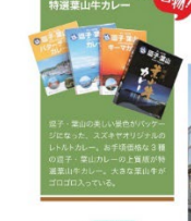
「ススキヤ」の味を再現