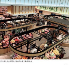
茨城県研究学園市 (030) 前橋駅前

新しい食の出会い楽しむ空間 新しい食の出会いを楽しむ空間。新しい食の出会いを楽しむ空間。新しい食の出会いを楽しむ空間。新しい食の出会いを楽しむ空間。