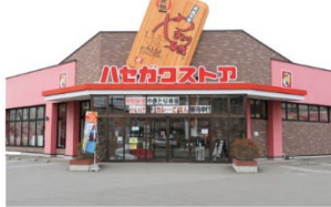
中道店 函館市 中道 1 丁目 3 番 1 号