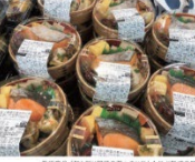
本場東京「都立」の味を再現。100種類以上のメニューを誇る