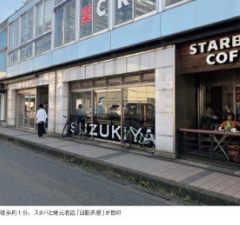
神奈川県横浜市神奈川区 (045) 前橋駅前

1992年創業。25周年を記念して、創業当時の味を再現。100種類以上のメニューを誇る。本場東京「都立」の味を再現。100種類以上のメニューを誇る。本場東京「都立」の味を再現。100種類以上のメニューを誇る。