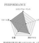
ギブソン LL6 (V100,000)