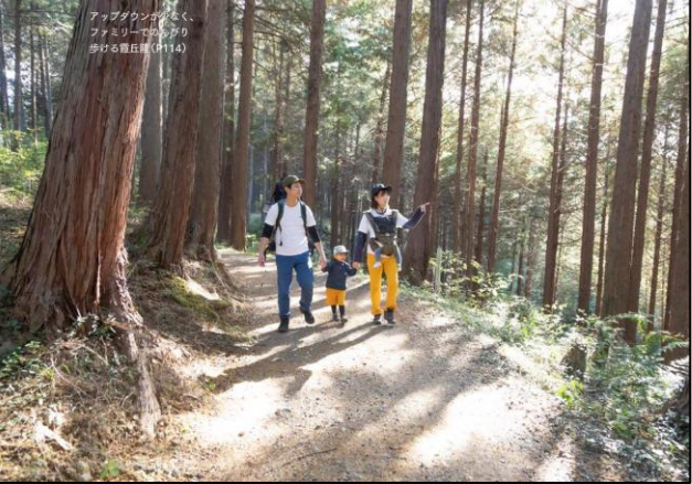
↑丹沢山麓が一望できるよこやまの道 (P44)