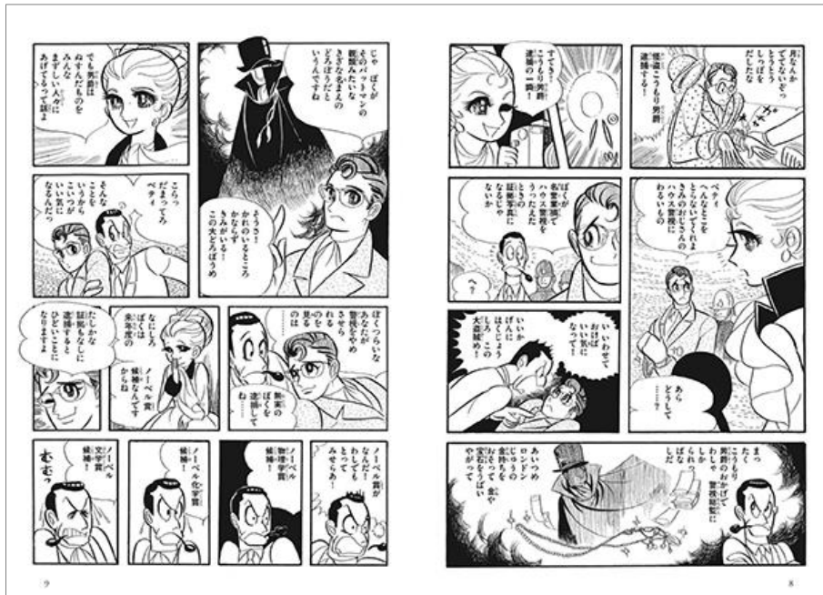
『怪盗こうもり男爵 #1』第1話より 新聞記者のベティとおじのハウス警視、アイザック・アシモフ教授。