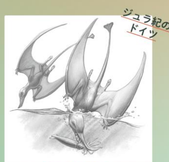
ジュラ紀の ドイツ 海に飛び込む 翼竜

第四紀氷河期（2万年前）から エディアカラン期（5億5000万年前）まで 絶滅してしまった生き物たちがよみがえる！