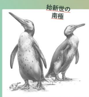
始新世の 南極 身長165cmの 巨大ペンギン