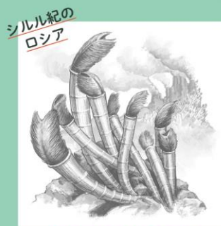
シルル紀の ロシア 最古の熱水噴出孔動物 ヤマンカシア