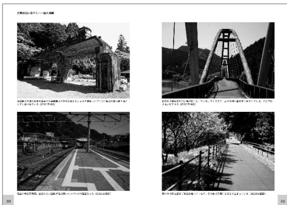
本作のため新たに撮影された写真資料も多数掲載