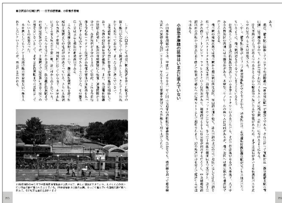
小田急多摩線延伸など、東京西郊の新線計画ルートの詳細を分析