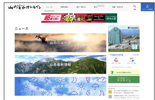
ニューストップページ