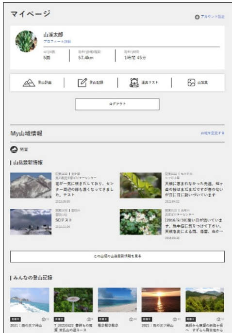
マイページトップ

登山計画・登山記録入力フォームのデザインを刷新し、基本情報から詳細情報へ、ページ切り替えで順を追って入力する形にしました。また表示要素も見やすく整理しています。さらに、一覧表示からも計画や記録の削除ができるようになり、操作性が向上しました。