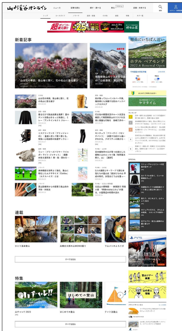
「記事を読む」トップページ

『山と溪谷オンライン』では、ウェブの特性を活かしながら出版社としての企画力を組み合わせて、魅力的な記事コンテンツを展開していきます。登山のプランニングに役立つ「コースガイド」や登山技術を解説する「ノウハウ」、最新の「道具・装備」といった実用情報に加えて、山の自然や登山文化など山の楽しみを深め、広げるコラム記事なども公開します。さらに、山のエキスパートによる連載企画や、「はじめての登山」「富士山ナビ」といった、テーマごとの特集コンテンツも設置。著者・監修者として、雑誌『山と溪谷』や山岳図書などでも活躍するライターや各分野の専門家が参加。最新の知見や登山のトレンドをとらえたオリジナル記事とともに、雑誌や山の本に関連するコンテンツも読むことができます。オリジナル記事に加えて、YouTube『山と溪谷 ch.』との連動企画では、技術解説などの動画コンテンツと組み合わせて理解を深められる記事作りも行なっています。また、全国の山岳エリアから日々発信される登山道の状況や花の開花情報などを「山岳最新情報」のページで紹介。「山の天気」や、山や登山をめぐるトピックを紹介する「ニュース」など、週末の山登りに役立つ情報を毎日更新します。