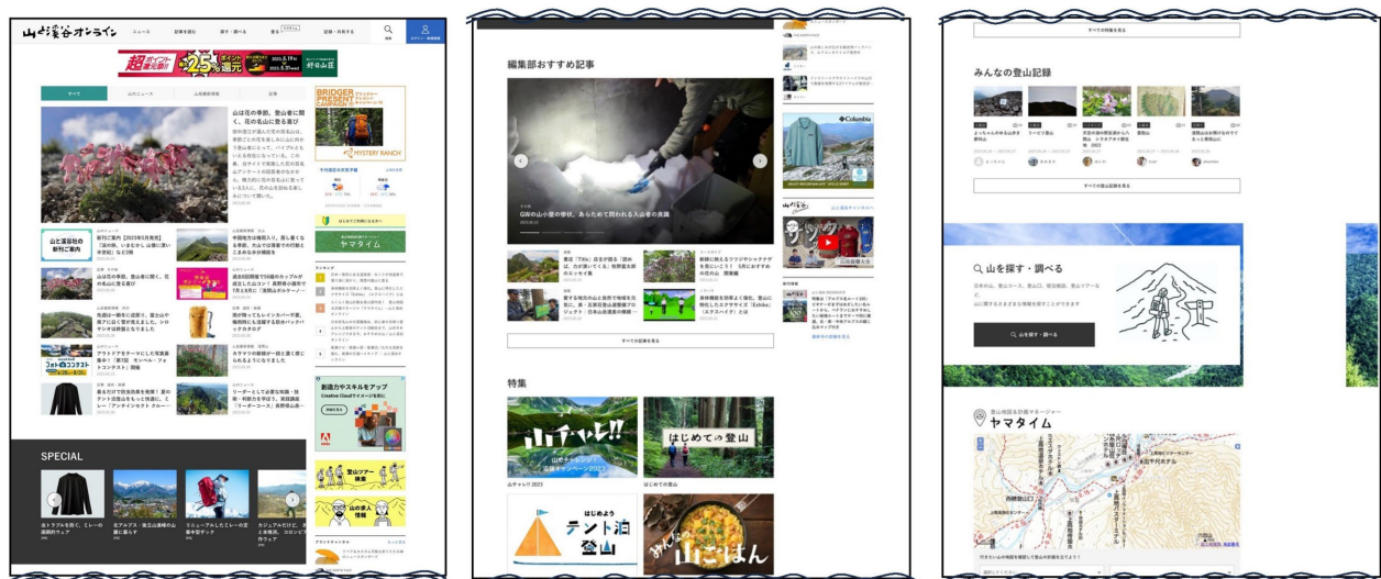
リニューアルした『山と溪谷オンライン』トップページ

『山と溪谷オンライン』 URL : https://www.yamakei-online.com/