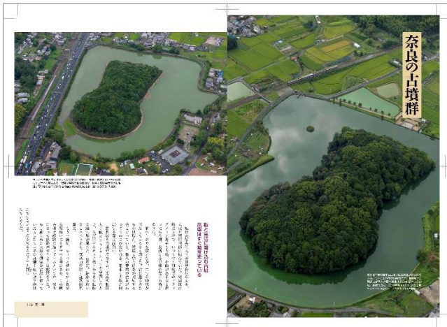
時空を越えた鉄道旅「第4章 悠久の時を越えて」