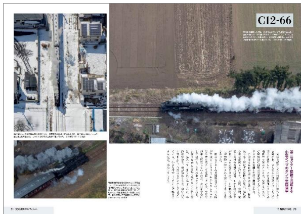
蒸気機関車の煙の迫力「第2章 躍動する煙」