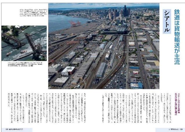
鉄道名所を外遊「第5章 異国のかおり」