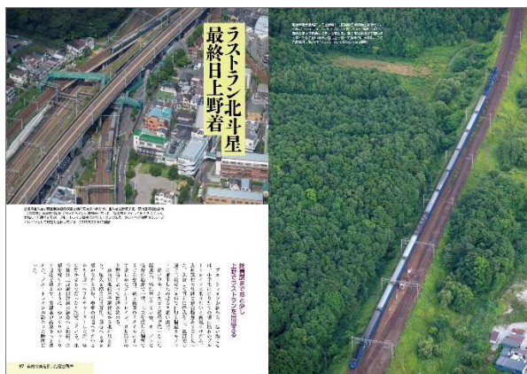
かつての勇姿を振り返る「第3章 望郷の鉄路」