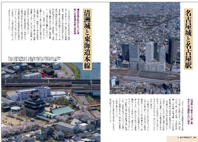
全国各地の名城との競演「第4章 悠久の時を越えて」