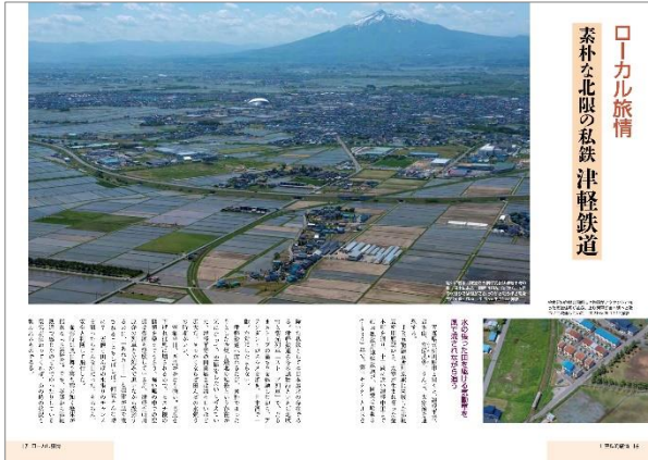
スケール感あふれる風景が魅力のローカル線「第1章 空鉄的旅情」

全国各地の季節や風土を、鉄道とともに捉えた「空撮鉄道旅情」の世界。ダイナミックなレイアウトで、その迫力と美しさをお楽しみいただけます。本文では、撮影時に著者が上空で感じたエピソードも交えて紹介します。