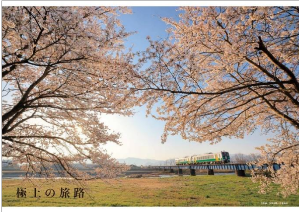
息をのむ、迫力の巻頭グラフ

季節を切り取る、光をとらえる……。傑作を生み出すコツを、新緑や水鏡、雲海など 15 のシチュエーションで、表現方法を具体的にレクチャーします。