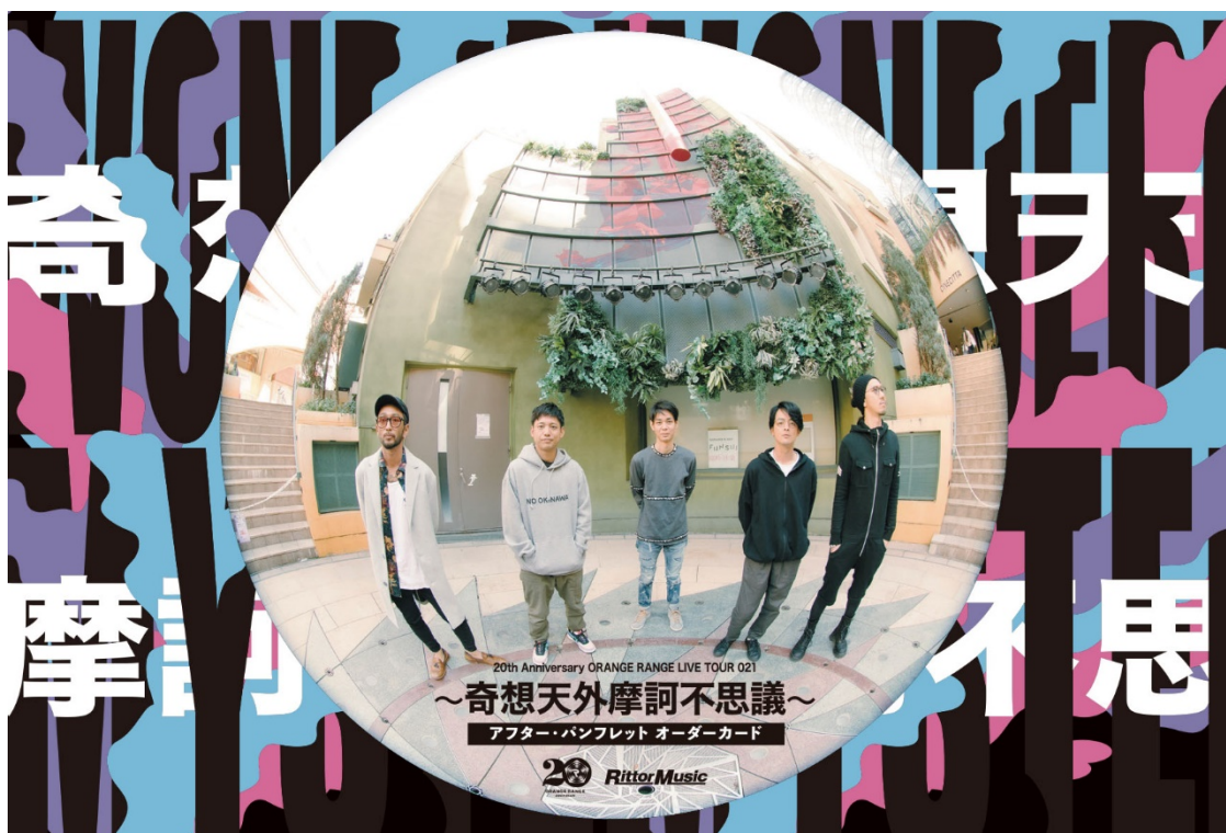
▲ポストカード型のオーダーカード

本商品は、ORANGE RANGE の結成 20 周年記念ツアー「20th Anniversary ORANGE RANGE LIVE TOUR 021 ～奇想天外摩訶不思議～」のライブ写真やオフショットを収録したパンフレットです。2021 年 10 月 1 日の Zepp Osaka Bayside から 2021 年 10 月 24 日のおりなす八女ハーモニーホールまでの全 10 会場で、固有のシリアルコードが振られた「オーダーカード」形式にて販売いたします。