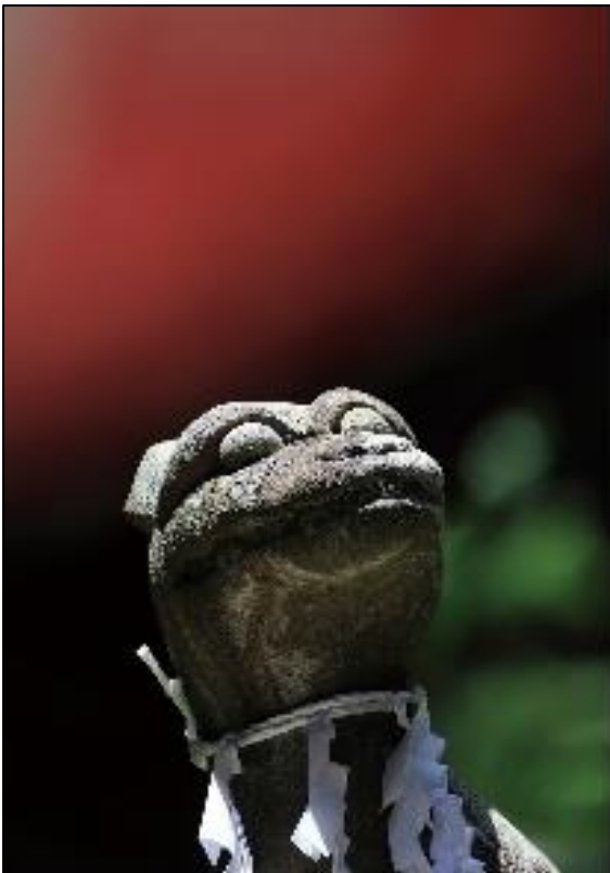
群馬県の狼像と狼祭り おぼやしぬえ

群馬県の狼像は、狼祭りと密接な関係にある。狼祭りは、狼の習性や生態を再現し、地域の文化や歴史を伝える重要な役割を果たしている。狼像の制作には、狼祭りの歴史や文化を踏襲しながら、近未来の狼像として制作された。狼像の制作には、狼祭りの歴史や文化を踏襲しながら、近未来の狼像として制作された。