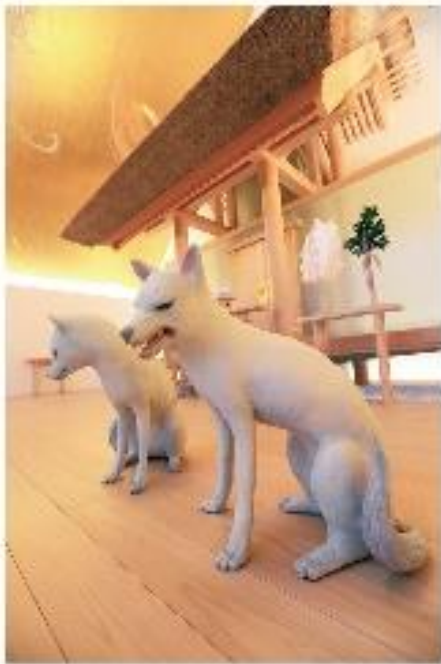
武蔵野半會和神社の狼像

武蔵野の半會和神社は、この狼像制作の第一歩、即ち「狼」のイメージを決定する重要な役割を果たした。この狼像は、神社の歴史や文化を踏襲しながら、近未来の狼像として制作された。狼像の制作には、神社の歴史や文化を踏襲しながら、近未来の狼像として制作された。狼像の制作には、神社の歴史や文化を踏襲しながら、近未来の狼像として制作された。