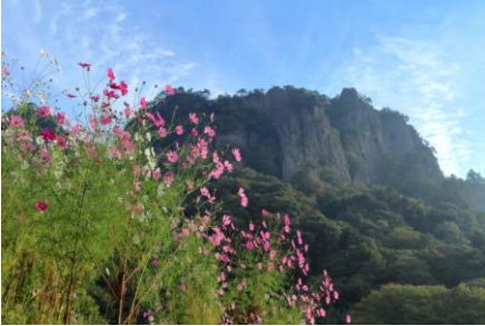
真田幸村が育ったとされる岩櫃山

織田信長、真田幸村、明智光秀など戦国時代に活躍した武将たちにゆかりのある山を巡ります。かつての勇将達が眺めた景色を体験しましょう。