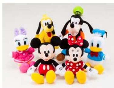
↑特別企画「ビーンズコレクション110体プレゼント」 http://www.mdn.co.jp/wd13/