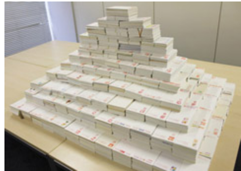
↑前回のチャリティで集まった 約66,000枚のはがきの山