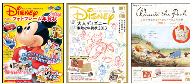
↑ファミリーや女性に大人気のディズニー年賀状

デザイン力NO.1のデザイン年賀状から、女性やファミリーに人気のディズニー年賀状など4誌が好評発売中です。ディズニー年賀状3誌では、ウォルト・ディズニー生誕110周年を記念したディズニーキャラクター110体のぬいぐるみを抽選で3名にプレゼントする特別企画「ビーンズコレクション110体プレゼント」も開催しています。