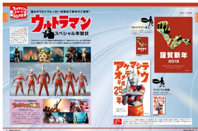
↑ウルトラマンシリーズ誕生45周年記念 「ウルトラマン」年賀状