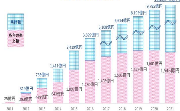
くまモン利用商品売上高の推移

民間企業・団体によるくまモンを利用した商品等の売上高について、2011年の調査開始からの売上高累計は、1兆1,341億円となり、目標の1兆円を超えました。なお、2021年の売上高は、1,546億5,892万円であり、長引く新型コロナウイルス感染症拡大の影響等で、前年から55億3,675万円減少し、調査開始以来、初めて減少しました。