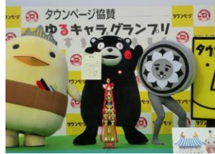
2011年 ゆるキャラ@グランプリ2011で優勝