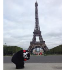
2019年 フランス観光親善大使任命