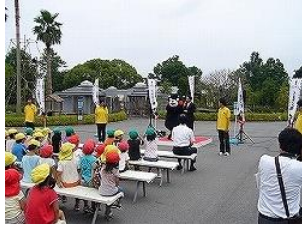
2010年 くまモンデビュー