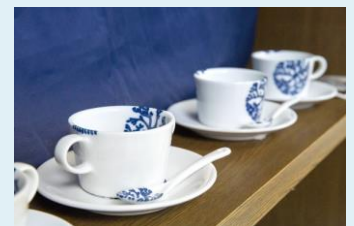
天草陶磁器（高浜焼）

天草西海岸で採れる 天草陶石と陶土は品質、埋蔵量ともに日本一 と言われています。強度が高く、焼き上がりは濁りのない透き通った美しい色に仕上がるのが特徴の陶石は、 国内生産の半数以上を占め、有田焼などの県外の焼き物産地に出荷 されています。江戸時代の発明家、平賀源内が「天下無双の上品」と絶賛したと伝えられています。天草陶石と陶土を使って焼かれる「天草陶磁器」は、 国の伝統工芸品として指定 されています。