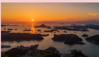
高舞登山からの夕陽