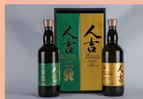
【人吉市】人吉5年&15年飲み比べセット（限定15セット）