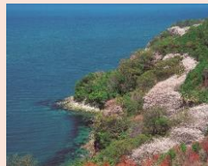
湯の児チェリーライン