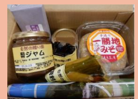
【球磨村】球磨川のおずかりものセット（限定30セット）