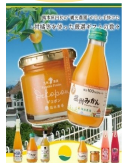
福田農場ギフトセット （¥10,000（税込））