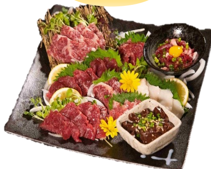
馬刺し7種復袋セット （¥5,000（税込））