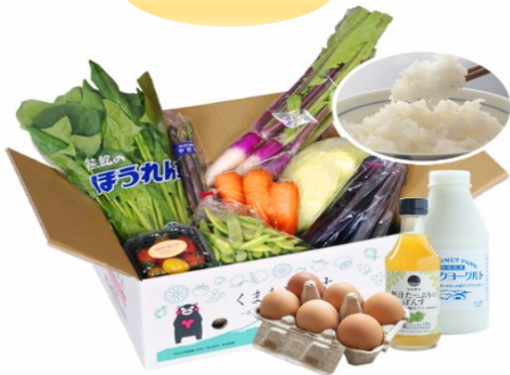
旬の野菜くまもと応援復袋 （¥5,000（税込））