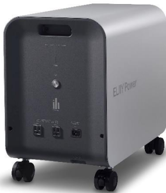
可搬型蓄電システム 「POWER YIILE 3」

※1 新品時の目安として最大30時間。周囲温度等の条件によって稼働時間は変わります