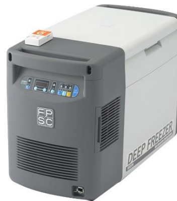
ツインバード製 「SC-DF25WL DEEP FREEZER 25L」