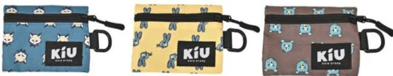
フォックスフェイス