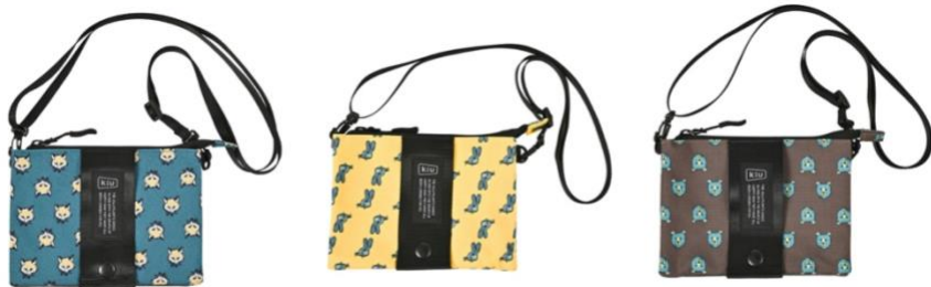
フォックスフェイス