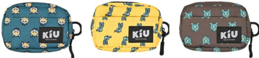
フォックスフェイス