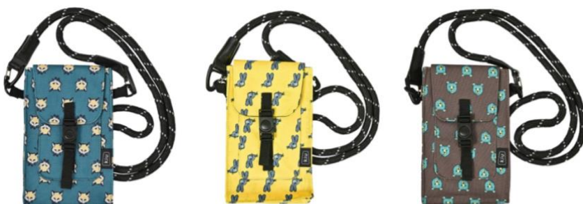
フォックスフェイス