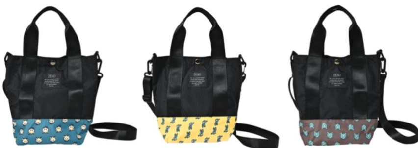
フォックスフェイス