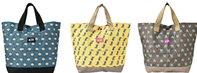
フォックスフェイス