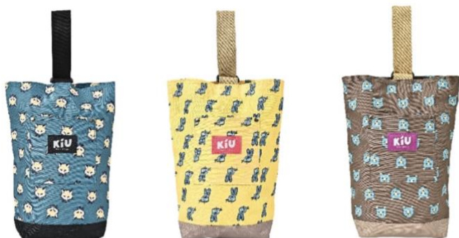
フォックスフェイス