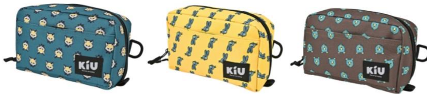
フォックスフェイス