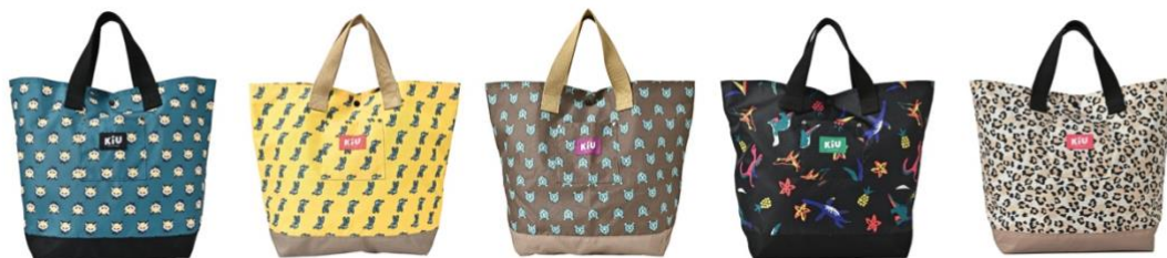
フォックスフェイス

内側には名札を入れられるネームポケットがついており、お友達と間違える心配もありません。