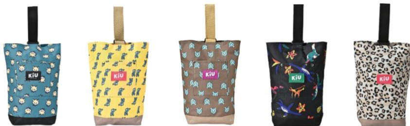
フォックスフェイス