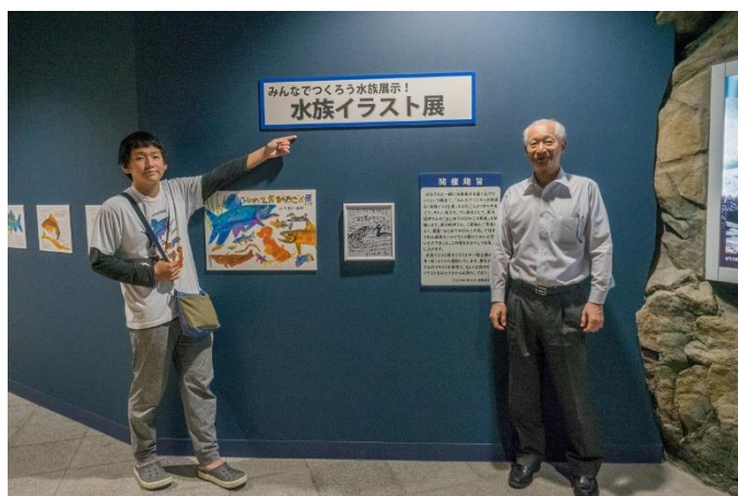
写真3. 水族イラスト展プレ展示の様子 (2023年6月24日)

2023年8月1日～2024年4月7日まで開催していた水族イラスト展のプレ展示として、「はじめてのびわこの魚」のイラストを提供していただきました。水族展示室を利用者の皆様と作り上げていきたいという趣旨で始まった水族イラスト展を盛り上げていただきました。