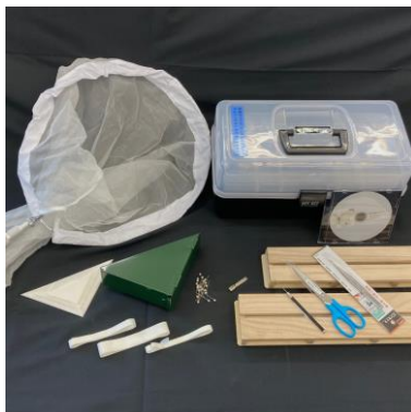
チョウの採集と標本作りセット