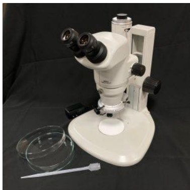
実体顕微鏡セット