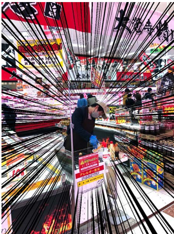
1個も売れないTAKEOスタッフ