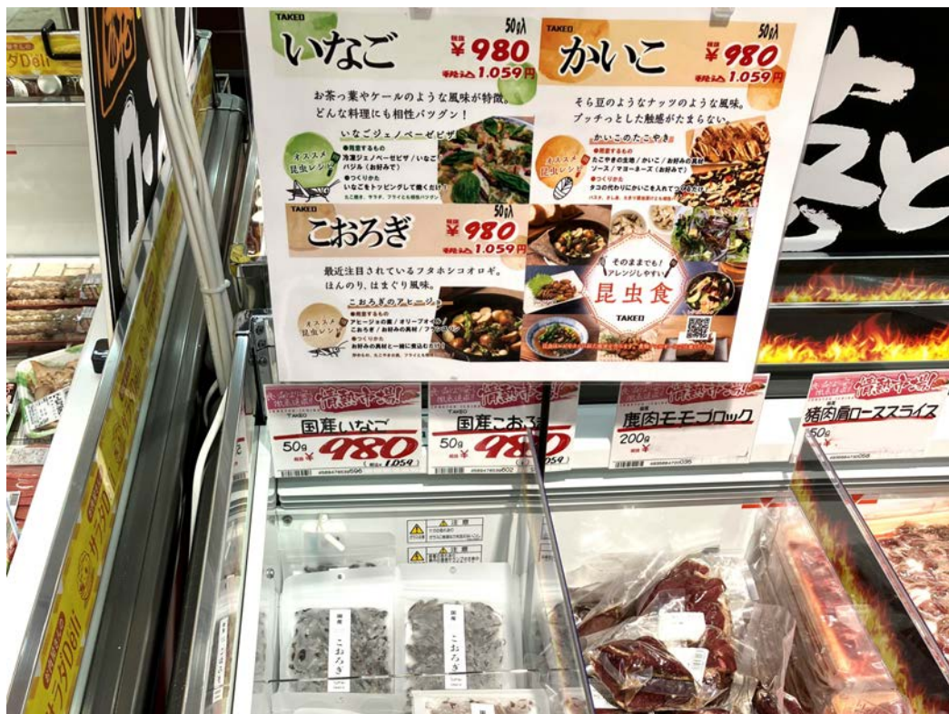
MEGAドン・キホーテUNY大覚寺店 売り場

内容量はそれぞれ50g、希望小売価格は税込980円です。しかし、昆虫は一度にあまり多くの量を食することができない場合が多いです。50gというのは少々内容量が多すぎたかもしれません。内容量やラインナップを含め、様子を見ながら今後も改良していく計画です。