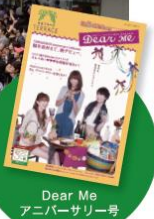
Dear Me アニバーサリー号