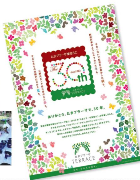
フラワーアートイベント