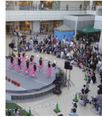
フラダンスで南国気分！

すっかり恒例イベントとなった、フラハワイ様によるフラフェスティバル。本場ハワイのコンテスト で優勝経験のあるメンバーを中心に、フラダンスや ハワイアンミュージックをお届けいただきました。