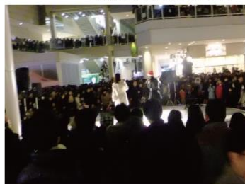
1,200名が観覧した、青山テルマさんのクリスマスイブスペシャルライブ。