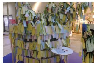
たくさんのお客さまにご参加いただきました。