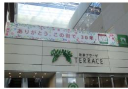
ゲートプラザ横断幕