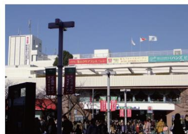
多くのお客さまに新年のお買い物をお楽しみいただきました。