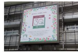
ゲートプラザ大型幕