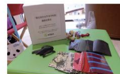
エーグル様らしいエコなイベントです。