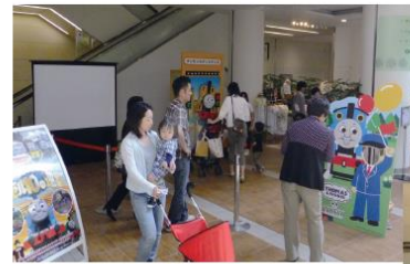
ポケットコートに色々なアトラクションが登場しました。

きかんしゃトーマスとのオリジナルコラボ商品の販売を始め、フォトスポットや限 定カプセルトイなどが登場し、お子さまを中心に大盛況。2012年5月に続き9月も開 催しました。