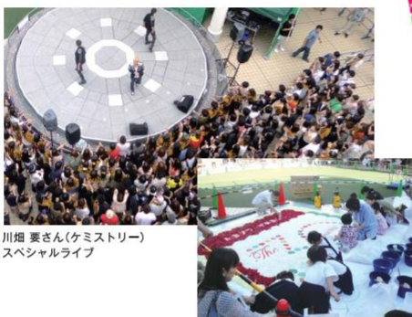
川畑 妻さん(ケミストリー)スペシャルライブ