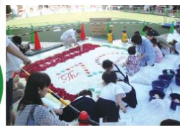
10月4日 フラワーアートイベント Before