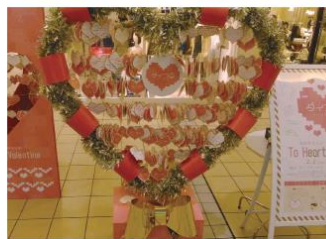
小さなハートが大きなハートになりました!