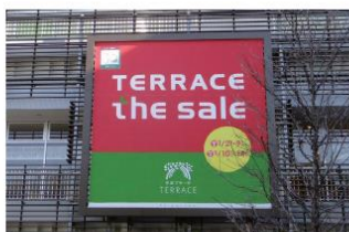
ステーションコート大型幕