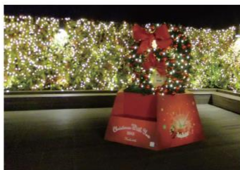
テラスダイニングのフォトスポットイルミネーション