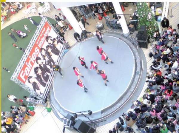
可愛い歌声とダンスに、600名の観覧者が大盛り上がり。

人気急上昇中のアイドルグループ「フェアリーズ」の NEWシングル発売記念スペシャルライブが行われました。