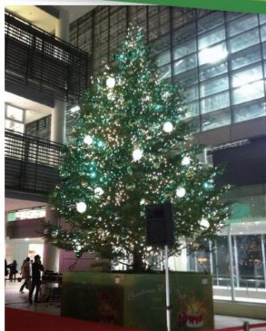
ステーションコートに3年ぶりに復活した生木ビッグツリー