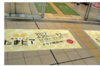
ご家族でお越しになるお客さまも多くいらっしゃいました。