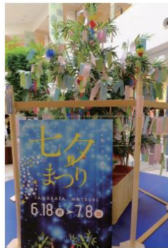
ゲートプラザ1FモールA口