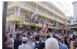
街のいたるところで開催された大道芸。

we love tamaplaza project 第2弾の夏まつりを今年も開催しました。スタンプラリーや恒例の夏祭り・ゆかたコンテスト、一昨年度に引き続き気仙沼復興市も行いました。