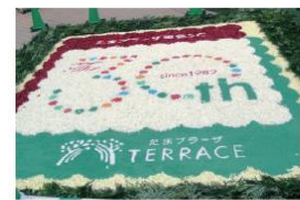
10月4日 フラワーアートイベント After