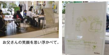
お父さんの笑顔を思い浮かべて。